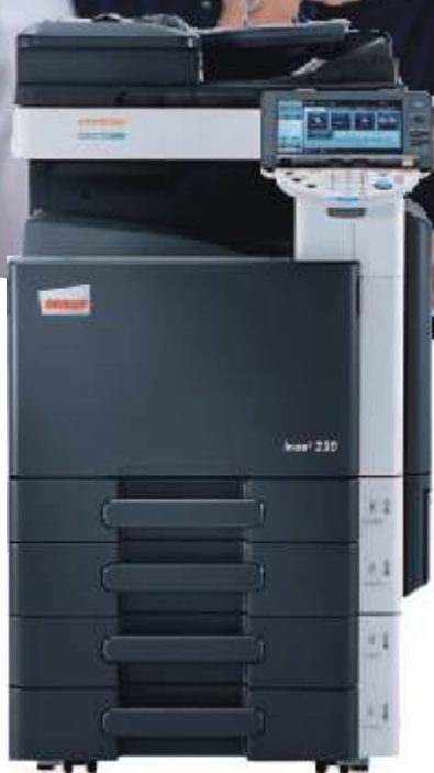
ineo+ 220 con alimentador de documentos (DF-617) y pedestal con 2 bandejas universales de 500 hojas (PC-207)