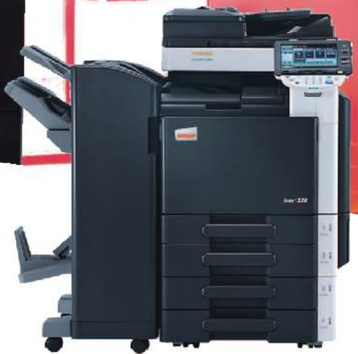
ineo+ 220 con alimentador de documentos (DF-617), finalizador (FS-527) con unidad de plegado opcional (SD-509) y pedestal con 2 bandejas universales de 500 hojas (PC-207)