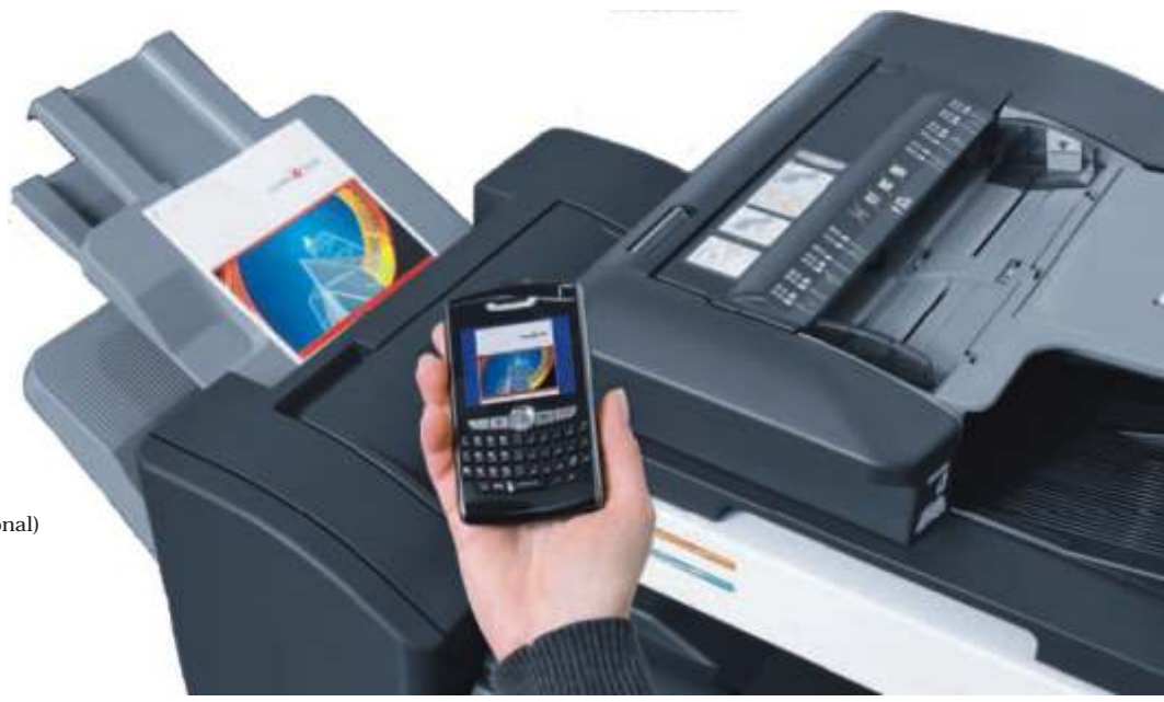
Impresión desde móvil por conexión blutetooth (Opcional)