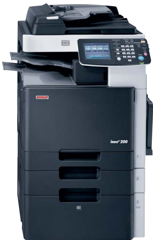
ineo+ 200 con alimentador de originales (DF-612), separador de trabajos (JS-505), bandeja bypass múltiple (MB-502), bandeja de papel universal (PC-105) y bandeja de papel de gran capacidad (PC-405)

La ineo+ 200 realiza también trabajos rutinarios como el envío de faxes y el escaneado de documentos sin ningún esfuerzo. Tras escanear una o varias hojas, los documentos se pueden guardar en formato PDF, JPEG o TIFF y enviarse a un PC o a una dirección de correo electrónico. La opción de fax permite ahorrar aún más tiempo. Incluso los faxes de varias páginas se introducen de forma autónoma con la bandeja de alimentación automática de documentos. En resumen, la ineo+ 200 asume desde el primer momento un importante papel para garantizar una comunicación empresarial eficaz, ¡y en color!