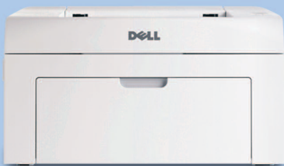
Impresora láser Dell 1110

Cree documentos monocromos nítidos y brillantes con la impresora láser Dell 1110.