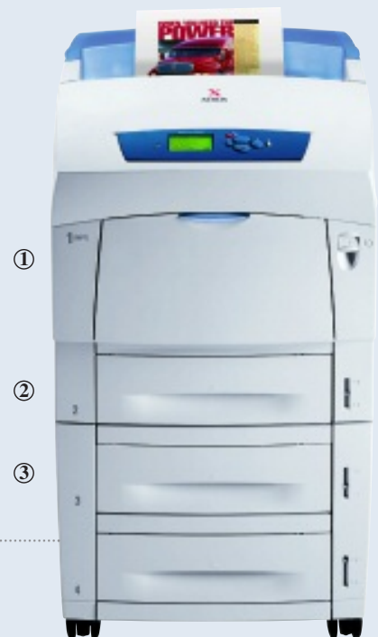
Impresora de color Phaser 6250DX

Impresión a doble cara automática, rápida y rentable (de serie en los modelos DP, DT y DX).